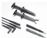
TL223 SureGrip 电气测试线套件